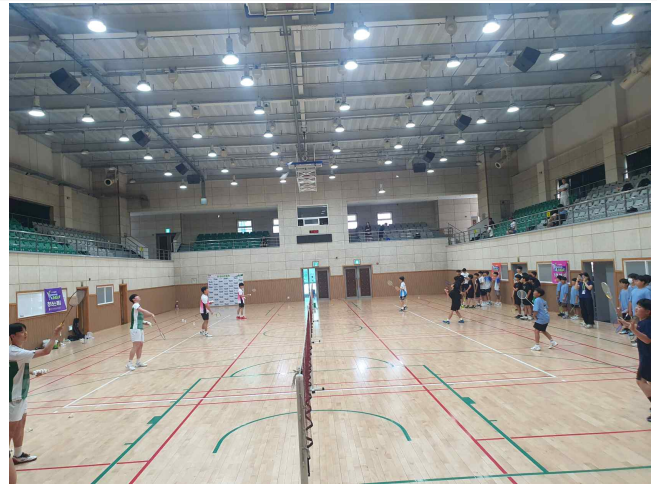
사진설명 : 클리어