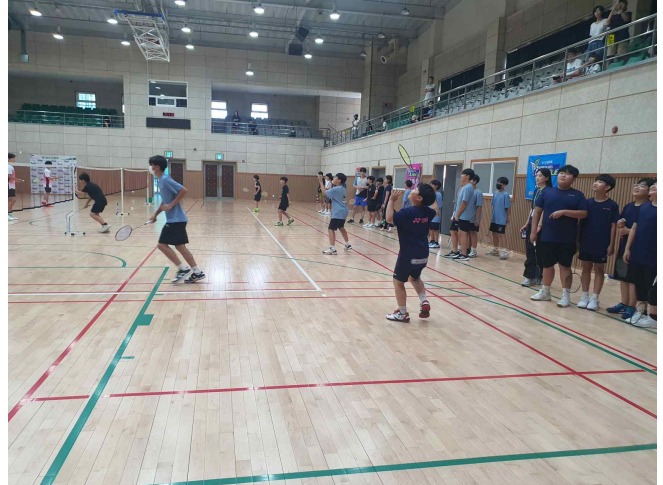
사진설명 : 스매시