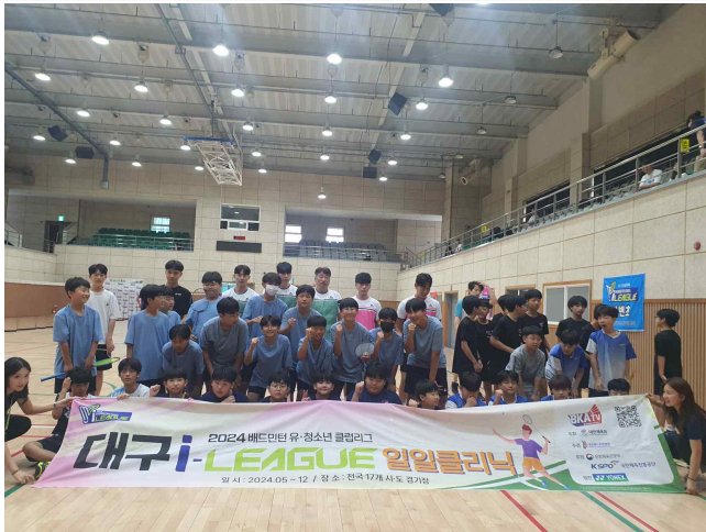
사진설명 : 단체사진