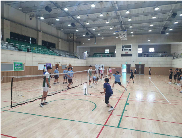
사진설명 : 헤어핀