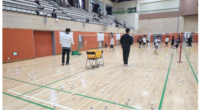
사진설명 : 레슨받는 선수들