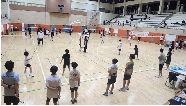
사진설명 : 선생님이랑 게임하는 선수들